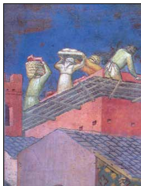
Ambrogio Lorenzetti, Il buon governo in città, particolare - Siena, Palazzo comunale. In copertina del volume La città prestata, consigli ai politici di Caterina da Siena, Città nuova editrice, 1990.

Valutazioni di quel tipo mi rammaricano, e mi sorprendono soprattutto quando provengono da lettori che con l'Eco hanno condiviso appassionate battaglie informative per tenere viva e aggiornata l'informazione monteclarense sui fatti politici e amministrativi che hanno caratterizzato la gestione della