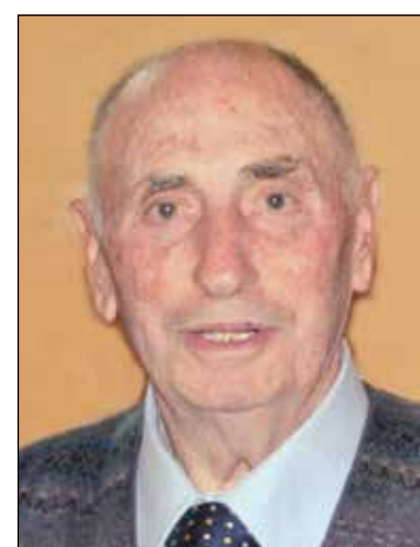
Natale Este 1° anniversario