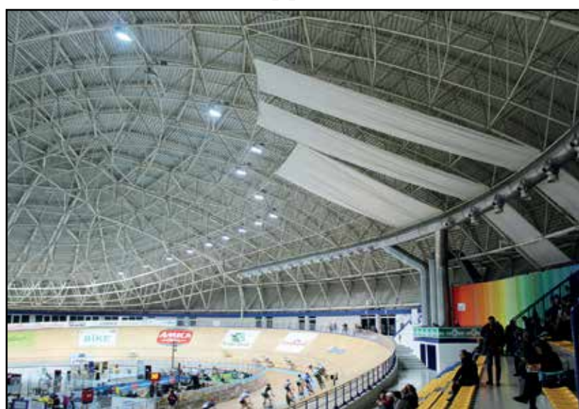
Teloni per salvaguardare la pista dalle gocce d'acqua.

A quasi un anno da quell'appello le cose sono notevolmen-